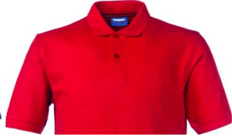
07 – ROJO