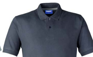
16 – ANTHRACITE