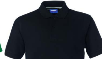
05 – NERO