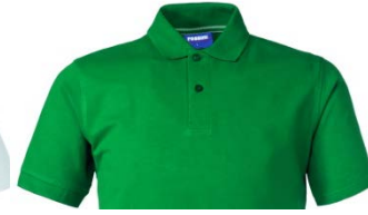
04 – VERDE