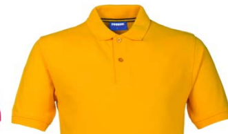
08 – AMARILLO