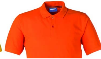
09 – ARANCIO