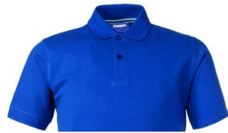
06 – AZUL REAL