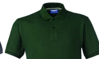
51 – BOTTLE GREEN