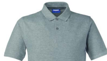
12 – GRIGIO MELANGE