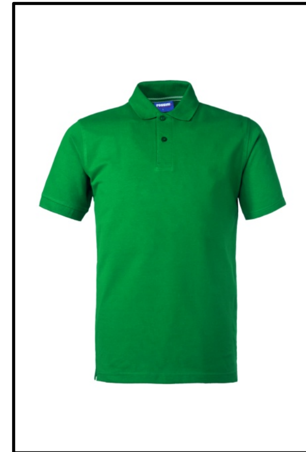
04 – VERDE