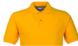
08 – GIALLO