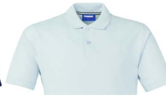
02 – WHITE