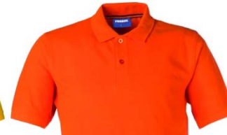
09 – ORANGE